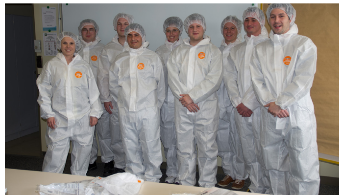
Für die Besichtigung bestimmter Arbeitsplätze ist das Tragen von sogenannten Reinraum-Anzügen Pflicht, damit die Leiterplatten bei der Herstellung nicht verunreinigt werden