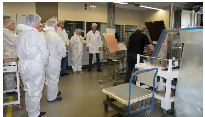
In der Produktion der Schweizer Electronic AG: Die Studierenden erhalten einen Einblick in die Herstellungsprozesse von Leiterplatten.